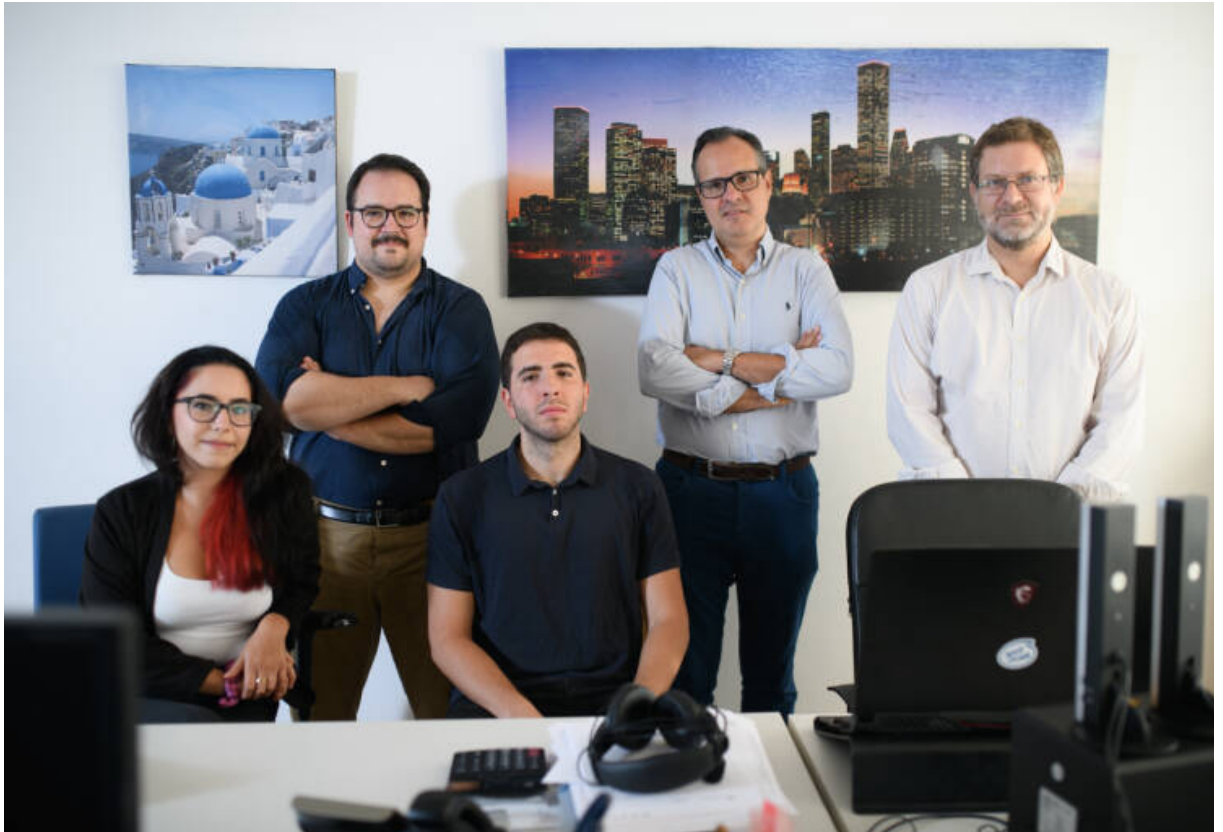
Equipo de Teborrar

experiencia, y que se ha especializado en mejorar o mantener la reputación online de las empresas, autónomos o profesionales.